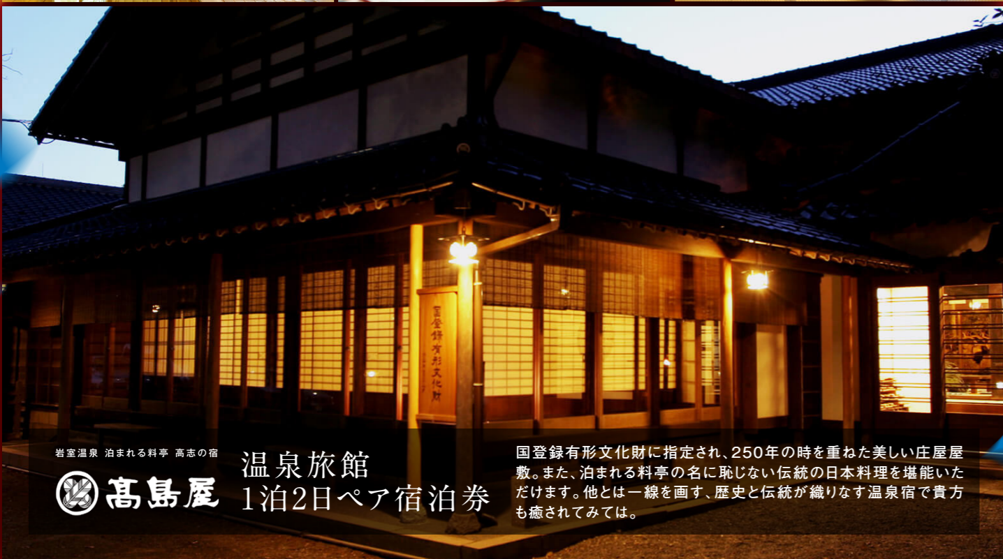
岩室温泉 泊まれる料亭 高志の宿